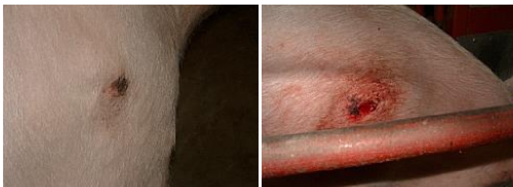
Figur 4. Bogsår av grad 1.

Revisorsanvisningar: Titta på den digivande suggan i var tredje box, förslagsvis samma box där man också tittar på rörelsemönstret hos suggor (indikator 2) och rörelsemönster hos smågrisar (indikator 3). Notera om alla, flertalet eller enstaka suggor är fria från bogsår av grad 1 respektive bogsår av grad 2 eller allvarligare, enligt bedömningsskalan nedan.